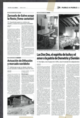
NUEVA ALCARRIA Noviembre 2013