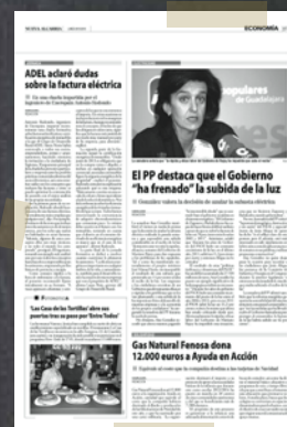
NUEVA ALCARRIA Diciembre 2013