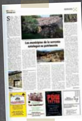
La Plazuela Septiembre 2013