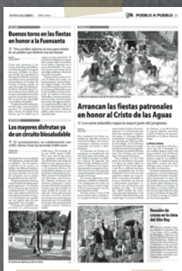
NUEVA ALCARRIA Septiembre 2013

DESCÁRGATE nuestra aplicación en Apple Store