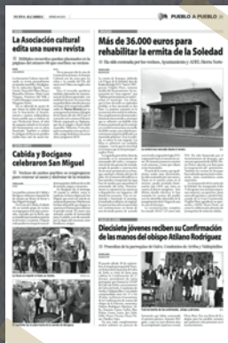
NUEVA ALCARRIA Octubre 2013