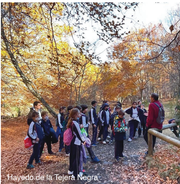
Hayedo de la Tejera Negra

Así, el grupo de desarrollo rural pone en marcha, de manera periódica, iniciativas para dar a conocer entre la población, y poner en valor, estos espacios naturales.