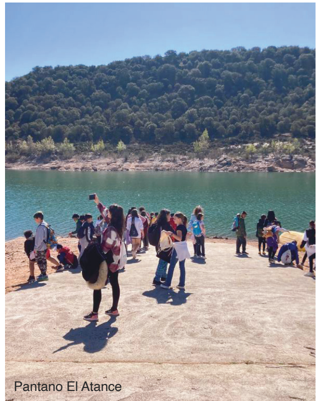
Pantano El Atance

Los alumnos de todos los centros educativos de la comarca han participado en actividades de sensibilización medioambiental convocadas por ADEL para dar a conocer los ecosistemas naturales del territorio acompañados por monitores medioambientales del territorio.