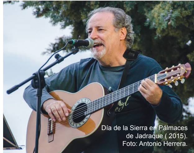
Día de la Sierra en Pálmaces de Jadraque (2015).

actos sociales, música, danza, trabajos artesanos, etc. He disfrutado mucho y, aunque, a veces, la tarea ha sido agotadora, el contacto con nuestras gentes y el cariño por su cultura me han ido manteniendo en el tajo, día tras día.